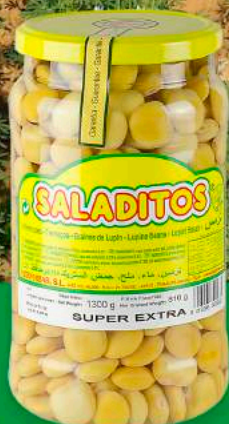
TARRO PET 1,3 KG

PESO NETO: 600G P.N.E: 380G CALIBRE : SUPER (13-15MM) ENVASADO: BANDEJA RETRACTILADA X 12 UDS PALET: 6 FILAS X 12 CJ= 72 CJ TOTAL UD. PALET: 72 CJ X 12 UDS=864 UDS