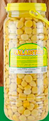
TARRO PET 4,1 KG

PESO NETO: 3KG P.N.E: 2KG CALIBRE : ESTÁNDAR (11-12 MM), EXTRA (12-13 MM), SUPER (13-15 MM), SUPREMA (15-17 MM) ENVASADO: CAJA X4 UDS. PALET: 4 FILAS X 14 CJ= 56 CJ TOTAL UD. PALET: 56 CJ X 4 UDS= 224 UDS