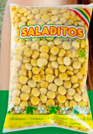
BOLSA 3 KG

PESO NETO: 1,3KG P.N.E: 810G CALIBRE : EXTRA (12-13 MM) SUPER(13-15 MM) ENVASADO: BANDEJA RETRAC X 6 UDS. PALET: 6 FILAS X 14 CJ= 84 CJ TOTAL UD. PALET: 84 CJ X 6 UDS=504 UDS