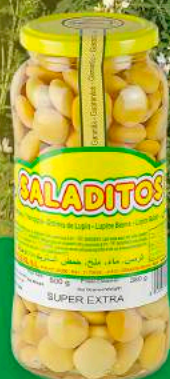
TARRO CRISTAL 600 GR

PESO NETO: 600G P.N.E: 380G CALIBRE : SUPER (13-15MM) ENVASADO: BANDEJA RETRACTILADA X 12 UDS PALET: 6 FILAS X 12 CJ= 72 CJ TOTAL UD. PALET: 72 CJ X 12 UDS=864 UDS